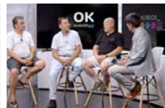
Entrevistas MENCIÓN ESPECIAL EN ENTREVISTAS Y REPORTAJES EN MEDIOS COM.