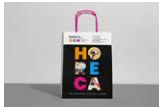
Bolsa LOGOTIPO PREMIUM ENTREGA A TODOS LOS VISITANTES