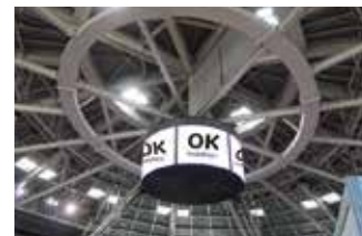
Videomarcador SÓLO EN MALLORCA