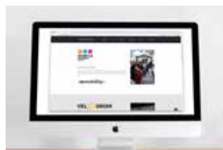
Web PRESENCIA DESTACADA PARTNER