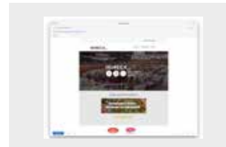
News LOGOTIPO Y NOTICIA EN WEB, REDES SOCIALES Y NEWSLETTER