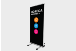
Roll Up ACCESO A LOS RECINTOS