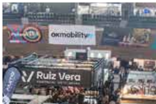
Lona 2 LONAS EN RECINTO 8X4 METROS