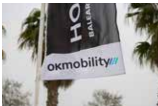
Banderolas ENTRADA AL RECINTO