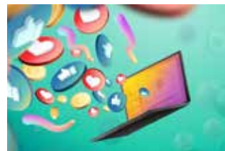
Medios Digitales PRESENCIA DESTACADA COMO PARTNER