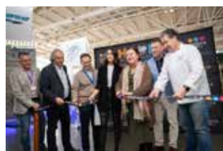
Inauguración PRESENCIA DESTACADA EN ACTO