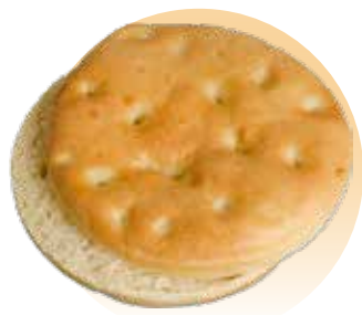
cod. 75003 Focaccia Al Olio Precortada 120g

Esta es la selección de panes que hemos escogido para que los concursantes preparen sus recetas eligiendo uno de ellos.