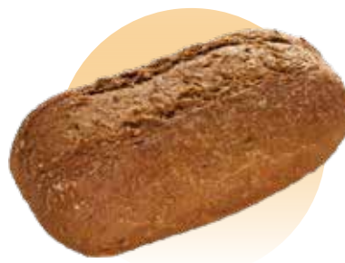
cod. 743653 Pan Alemán con Semillas y Cereales 450g