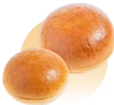
cod. 749034 Pan Burger Bun Brioche 80g