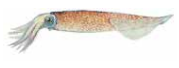
Pota Todarodes sagittatus