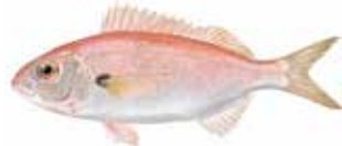
Besuc / Besugo Pagellus acarne