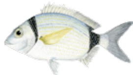
Variada / Mojarra Diplodus vulgaris