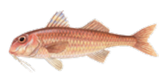
Moll de roca / Salmonete de roca Mullus surmuletus