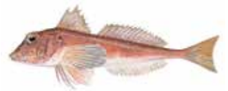
Oriola / Rubio Chelidonichthys cuculus