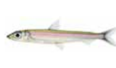
Polido Argentina sphyraena