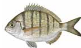
Sarg / Sargo Diplodus sargus