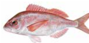
Pagell / Pagel Pagellus Erythrinus