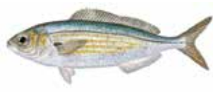
Boga Boops boops