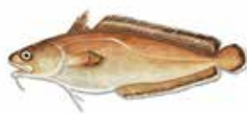
Mòllera / Brótola Phycis phycis